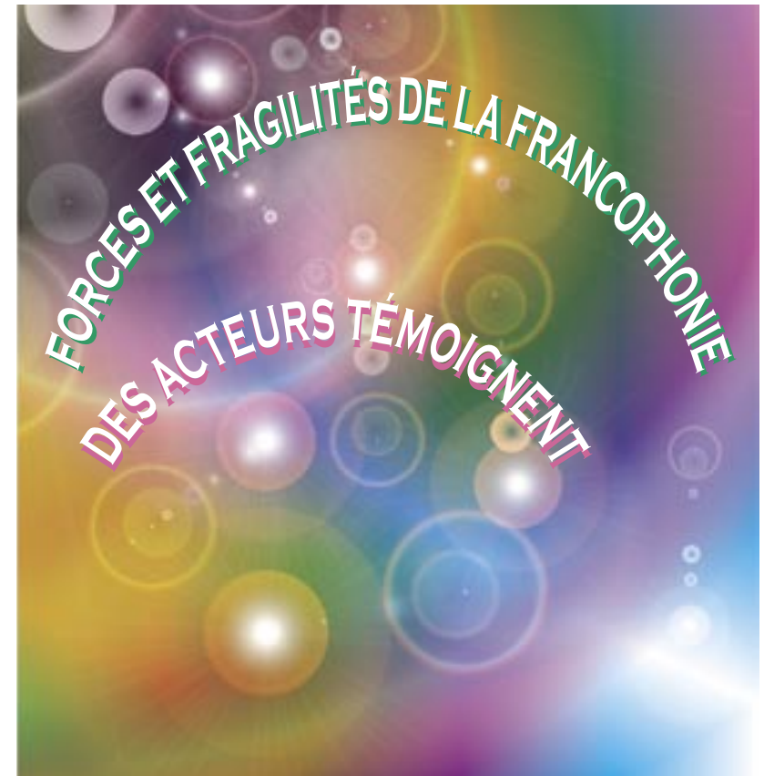
Table ronde Les Acteurs de la Francophonie

Maison des Sciences de l'Homme d'Aquitaine